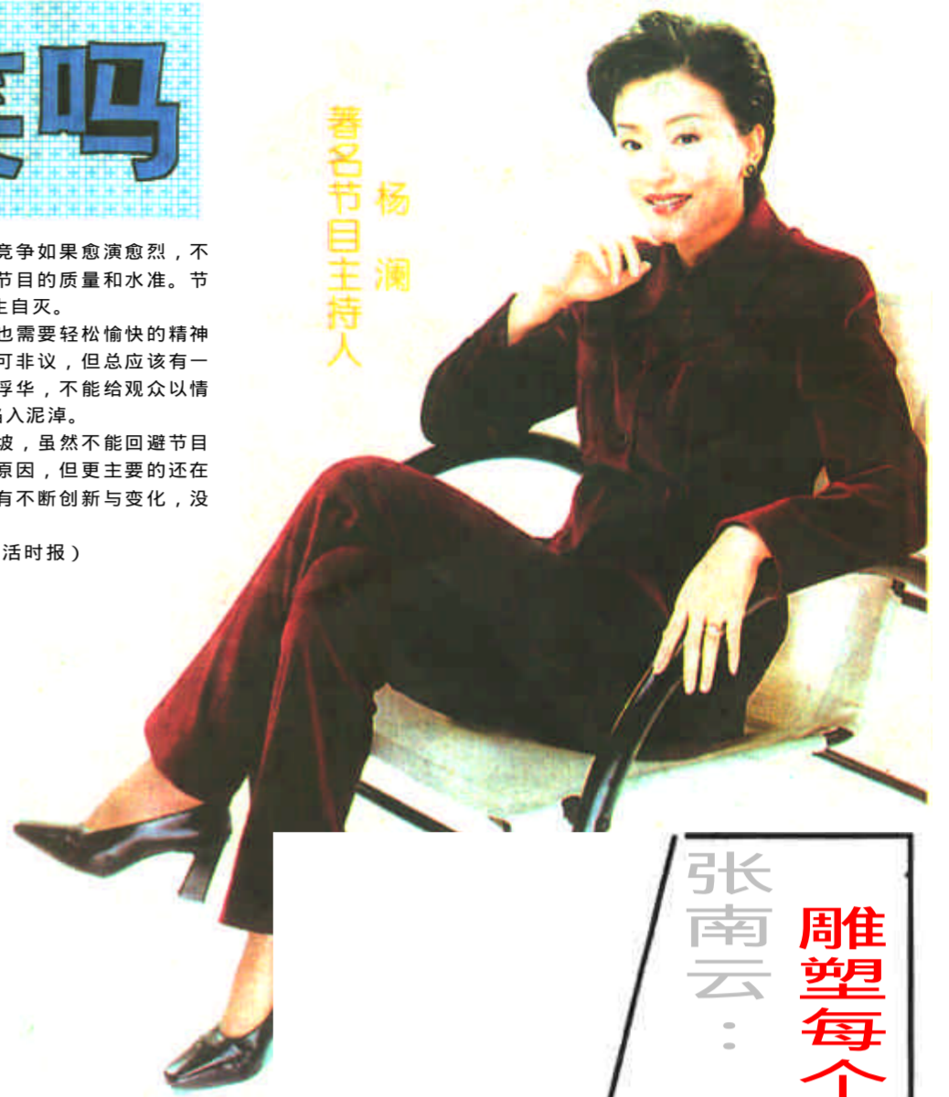
著名节目主持人 杨澜

蹈经济领域重复建设的覆辙，恶性竞争如果愈演愈烈，不但收视率有影响，而且会制约电视节目的质量和水准。节目处于惯性中将很难自拔，最后自生自灭。 但是电视需要娱乐节目，观众也需要轻松愉快的精神调剂，综艺节目强调其娱乐性本无可非议，但应该有一些文化品位才对，如果一味嬉笑和浮华，不能给观众以情趣的陶冶和积极向上的鼓舞，势必陷入泥潭。 其实，综艺娱乐节目收视的滑坡，虽然不能回避节目的增多造成收视群体分流这一客观原因，但更主要的还在于没有掌握当今观众的口味，没有不断创新与变化，没有跟上观众水平提高的步伐。 (生活时报)