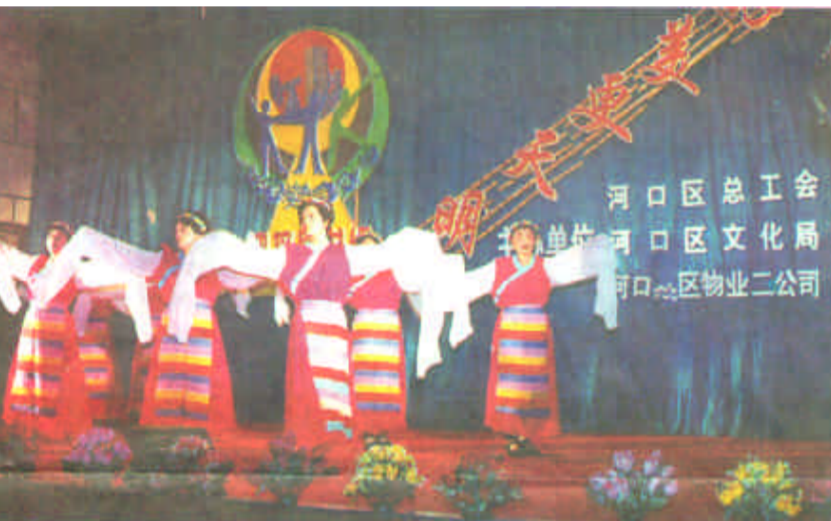
河口区总工会、河口区文化局、河口区物业公司联合举办的“迎新春、庆两会”文艺晚会现场。

在油田军共建区域文化工作中,妇女组织也是一支生力军,她们以“维护油田秩序,共建文明油区”为主题,先后组织开展了争创安全文明家庭、油地妇女健身操表演,油田军妇女时装表演和走进万家等活动,活跃了油田军妇女群众的文化生活,也充分展示了油田军妇女崭新的精神风貌,进一步加强了油田军联谊,密切了共建关系,极大地促进了油地军三方精神文明建设健康快速发展。